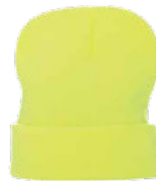
31500 CZAPKA ZIMOWA ARCTIC

Czapka z daszkiem wykonana z tkaniny szczotkowanej typu twill. Zapięcie regulowane metalową sprzączką. 5 paneli. Usztywnienie przedniego panelu. Obszyte wywieltrzniki. 100% bawełna. Kolor 34: 100%poliester.