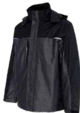
55520 KURTKA HIKE

Męska oddychająca kurtka z membraną. Materiał typu softshell połączony z mikropolarem. Na ramionach i przy zamkach kieszeni wstawki ozdobnego gumowanego materiału. Wydłużony tył. Kołnierz ze stójką. Kaptur chowany w stojce zapinanej na rzep. System ściągaczy w regulacji stójki kołnierza i u dołu wewnątrz. System 4 wywieltrzników pod pachą. Mankiety połączone z elastycznym materiałem z otworem na kciuk. Zamek główny kostkowy, plastikowy. Trzy zewnętrzne kieszenie zamykane na wodoodporny suwak. Markowe zamki ykk. Wewnątrz mała kieszeń zamykana na rzep. Dekoracyjne przeszycia. Wodoodporność: 8000 mm słupa wody. Oddychalność: 8000 g/m 2 /24h. 94% poliester, 6%elastan.