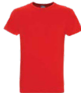
29100 T-SHIRT GEFFER 100

T-shirt męski z długim rękawem wykonany z dzianiny singlejersey. Klasyczny fason. Materiał poddany praniu enzymatycznemu, dzięki czemu jest pozbawiony nierówności wykończenie silikonowe materiału powodujące że jest miękki i miły w dotyku. Dekolt wykończony dwuwarstwowym ściągaczem z elastanem zapewniającym dłuższą trwałość. Taśma wzmacniająca na karku w kontrastowym kolorze. Ramiona z taśmą wzmacniającą i stabilizującą, która pozytywnie wpływa na trwałość szwów. Boczne szwy. Podwójne, gęste szwy do których wykorzystano nici najwyższej jakości. Dostępna w wersji damskiej 21403 ladies' voyage. 100% bawełna czesana ring-spun kolor 34: 90% bawełna czesana, 10% wiskoza.