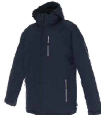
55544 KURTKA FOREST

Męska ciepła kurtka jesienno-zimowa. Materiał typu taslan. Klejone szwy. Wnętrze kurtki wyłożone siateczką. Wnętrze kaptura i rękawów wyścielone podszewką wykonaną z materiału typu taffeta. Odpinany polar o gramaturze 260 g/m 2 . Odpinany kaptur na zamek. System ściągaczy w regulacji kaptura i u dołu wewnątrz. Zamek główny kostkowy, kryty listwą zapinaną na rzepy. Trzy zewnętrzne kieszenie zamykane na zamek kostkowy. System 2 wywieltrzników pod pachą. Mankiety z regulacją na rzep. Elementy odblaskowe z przodu i z tyłu. Dół rozpinany od wewnątrz na zamek umożliwiający dojsie maszynyznakującej. Wodoodporność: 2000 mm słupa wody. Oddychalność: 2000 g/m 2 /24h. 100%poliester.