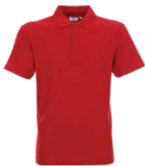
42250 KOSZULKA POLO COTTON

T-shirt męski z krótkim rękawem wykonany z dzianiny singlejersey. Dopasowany fason. Materiał poddany praniu enzymatycznemu, dzięki czemu jest pozbawiony nierówności. Dekolt wykończony dwuwarstwowym ściągaczem z materiału głównego. Kark i ramiona z taśmą wzmacniającą i stabilizującą, która pozytywnie wpływa na trwałość szwów. Boki bezszwowe zapewniające lepszy komfort w noszeniu i dające większe możliwości nadruku. Podwójne, gęste szwy do których wykorzystano nici najwyższej jakości. 100% bawełna na ring-spun.