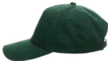
31001 CZAPKA Z DASZKIEM COMFORT

Męska pikowana kamizelka. Stójka wyścielona polarem o gramaturze 250 g/m 2 . Wnętrze wyścielone podszewką. Dekoracyjne przeszycia. Elementy odblaskowe z przodu i z tyłu. Dwustronny, kostkowy zamek główny. Kieszenie zamykane na zamki nylonowe. Kieszeń na piersi z zakrywającą zakładką. Wewnątrz zamykana kieszeń na dokumenty. System ściągaczy u dołu wewnątrz. Dół rozpinany od wewnątrz na zamek umożliwiający dojsie maszynyznakującej. 100% poliester.