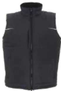
68925 KAMIZELKA NEW ROAD

Męska bluza polarowa wykonana z mikropolaru. Pionowe cięcia modelujące. Zamek główny kostkowy, plastikowy. System ściągaczy dołu wewnątrz. Elastyczna taśma wszyta w mankietach. Wykończenie antypillingowe materiału zapobiegające mechaceniu się. 100%poliester.