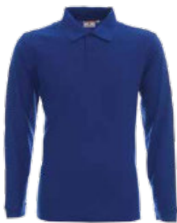
42350 KOSZULKA POLO LONG COTTON

Męska koszulka polo z krótkim rękawem wykonana z dzianiny pique. Klasyczny fason. Materiał poddany praniu enzymatycznemu, dzięki czemu jest miękki i pozbawiony nierówności. Płaski kołnierz wykonany ze ściągaczem 1x1 z podwójnymi strukturalnymi paskami. Kołnierz i ramiona z taśmą wzmacniającą i stabilizującą, która pozytywnie wpływa na trwałość szwów. Rozcięcie na bokach wykończone taśmą wzmacniającą od wewnątrz. Trzy guziki. Podwójne, gęste szwy do których wykorzystano nici najwyższej jakości. 90% bawełna czesana i 10% poliester kolor 48: 70% bawełna czesana, 30% poliester.