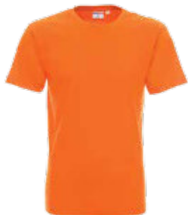
21172 T-SHIRT HEAVY 170

T-shirt męski z krótkim rękawem wykonany z dzianiny singlejersey. Klasyczny fason, materiał poddany praniu enzymatycznemu, dzięki czemu jest pozbawiony nierówności. Wykończenie silikonowe materiału powodujące, że jest miękki i miły w dotyku. Dekolt wykończony dwuwarstwowym ściągaczem z elastanem zapewniającym dłuższą trwałość. Kark i ramiona z taśmą wzmacniającą i stabilizującą, która pozytywnie wpływa na trwałość szwów. Boki bezszwowe zapewniające lepszy komfort w noszeniu i dające większe możliwości nadruku. Podwójne gęste szwy do których wykorzystano nici najwyższej jakości. Dostępna w wersji damskiej 22160 ladies' heavy. 100% bawełna półczesana ring-spun; kolor 34: 90% bawełna półczesana, 10% wiskoza.