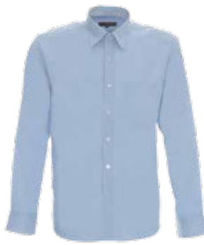
93100 KOSZULKA RIVER

Prosta, klasyczna bluza męska wykonana z miękkiej dzianiny. Materiał od wewnątrz szczerotkowany. Dekolt, rękawy oraz dół bluzy wykończone dwuwarstwowym ściągaczem z elastanem 2x2, zapewniającym dłuższą trwałość. Kark i ramiona z taśmą wzmacniającą i stabilizującą, która pozytywnie wpływa na trwałość szwów. Podwójne, gęste szwy do których wykorzystano nici najwyższej jakości. 80% bawełna, 20% poliester.