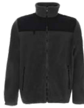
68140 BLUZA POLAROWA GUARD

Koszulka męska wykonana z tkaniny oxford. Klasyczny fason. Uszytywniony kołnierz ze stojką. Kieszeń na piersi. Kołnierz i mankiety wykończone kontrastowym materiałem od wewnątrz. 70% bawełna, 30% poliester.