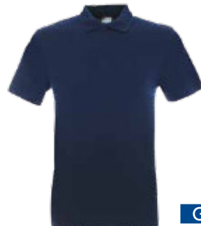
49000 POLO GEFFER 400

Męska koszulka polo z długim rękawem wykonana z dzianiny pique. Klasyczny fason. Materiał poddany praniu enzymatycznemu, dzięki czemu jest miękki i pozbawiony nierówności. Płaski kołnierz wykonany ze ściągaczem 1x1 z podwójnymi strukturalnymi paskami. Kołnierz i ramiona z taśmą wzmacniającą i stabilizującą, która pozytywnie wpływa na trwałość szwów. Rozcięcie na bokach wykończone taśmą wzmacniającą od wewnątrz. Rękawy zakończone ściągaczem 1x1. Trzy guziki. Podwójne, gęste szwy do których wykorzystano nici najwyższej jakości. 90% bawełna czesana, 10% poliester.