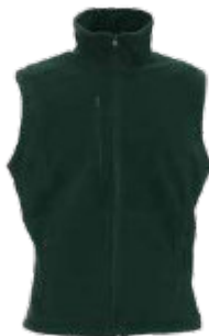
68202 KAMIZELKA VERSO

Męska, gruba bluza polarowa wykonana z mikropolaru. Lekko dopasowany fason. Dekoracyjne przeszycia. Zamek główny oraz kieszeni kostkowy, plastikowy. Zamykana kieszeń na piersi. System ściągaczy dołu wewnątrz. Dół oraz mankiety zakończone elastyczną lamówką. Obustronne wykończenie antypillingowe materiału zapobiegające mechaceniu się. 100%poliester.