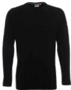
21400 T-SHIRT VOYAGE

T-shirt męski z krótkim rękawem wykonany z dzianiny singlejersey. Klasyczny fason, materiał poddany praniu enzymatycznemu, dzięki czemu jest pozbawiony nierówności. Wykończenie silikonowe materiału powodujące, że jest miękki i miły w dotyku. Dekolt wykończony dwuwarstwowym ściągaczem z elastanem zapewniającym dłuższą trwałość. Kark i ramiona z taśmą wzmacniającą i stabilizującą, która pozytywnie wpływa na trwałość szwów. Boki bezszwowe zapewniające lepszy komfort w noszeniu i dające większe możliwości nadruku. Podwójne gęste szwy do których wykorzystano nici najwyższej jakości. Dostępna w wersji damskiej 22160 ladies' heavy. 100% bawełna półczesana ring-spun; kolor 34: 90% bawełna półczesana, 10% wiskoza.