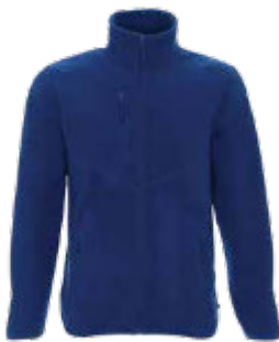
68160 BLUZA POLAROWA FOXY

Męska, gruba bluza polarowa wykonana z mikropolaru. Lekko dopasowany fason. Dekoracyjne przeszycia. Zamek główny oraz kieszeni kostkowy, plastikowy. Zamykana kieszeń na piersi. System ściągaczy dołu wewnątrz. Dół oraz mankiety zakończone elastyczną lamówką. Obustronne wykończenie antypillingowe materiału zapobiegające mechaceniu się. 100%poliester.