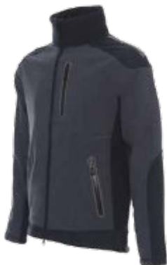
51440 KURTKA STORM

Klasyczna czapka zimowa wykonana z miękkiej dzianiny. Do kompletu komin model 31502 arctic neck. 100%akryl.